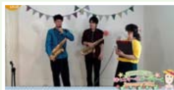
《生配信》オンラインminiほっこり~のパーティー★summer2021

コロナ禍の間も、赤ちゃんとママのためのサロン(十条、志茂)をずっと開いております。