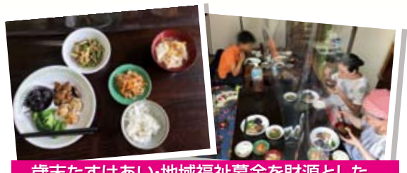
歳末たすけあい・地域福祉募金を財源とした助成利用団体のご紹介

※町会自治会、赤十字奉仕団などが中心となって募金活動を行っています。みなさまのご協力をお願いいたします。 お問合せ 管理係 ☎03-3906-2352