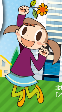
北社協キャラクター「アイちゃん」