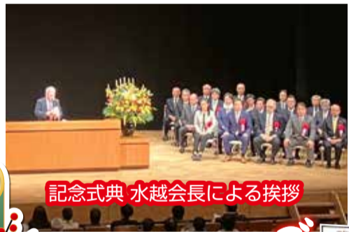
記念式典 水越会長による挨拶