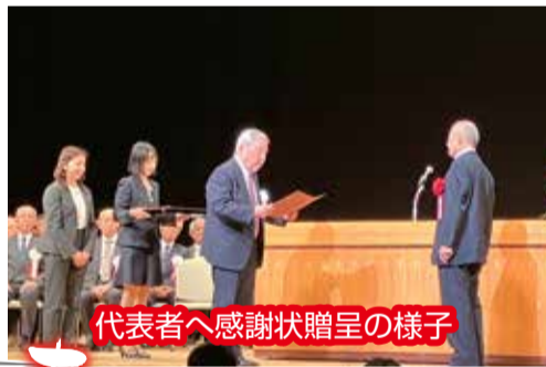
代表者へ感謝状贈呈の様子