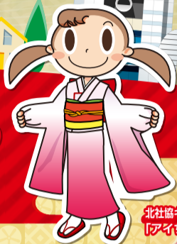
北社協キャラクター「アイちゃん」