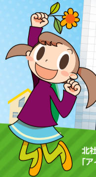
北社協キャラクター「アイちゃん」