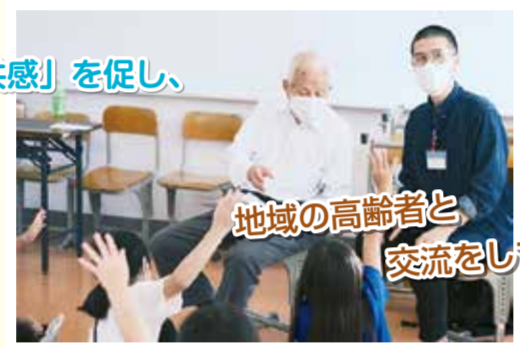
地域の高齢者と交流している様子