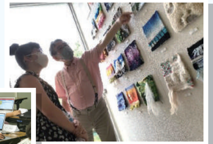
夢絵師プロジェクト

みなさまからいただいたご支援で 令和4年度は13名の子ども・若者が プログラムに参加できました(^^)