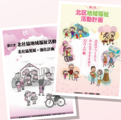
北区地域福祉活動計画(左:第2次、右:第3次)