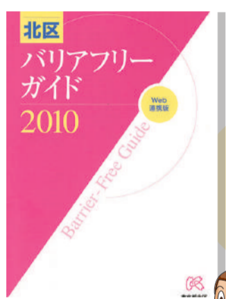
北区バリアフリーガイド