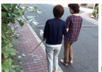
ガイドヘルパー派遣事業