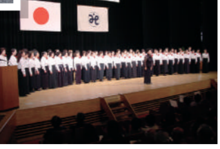
創立50周年記念式典 民生委員コーラスの様子