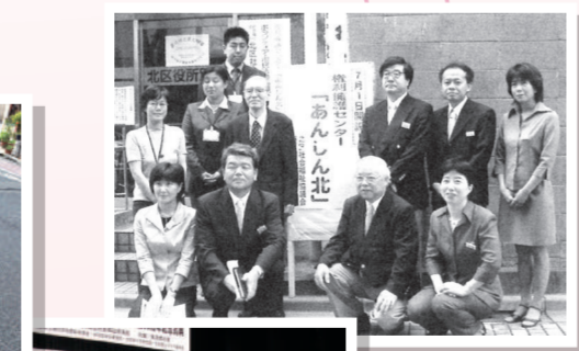
権利擁護センター「あんしん北」開設