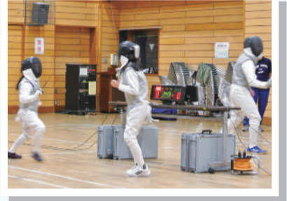
フェンシングにチャレンジする小4のお子さま