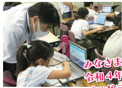
プログラミングチャレンジ

みなさまからいただいたご支援で 令和4年度は13名の子ども・若者が プログラムに参加できました(^^)