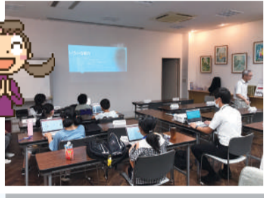
本格的なプログラミング講座

技術：プログラミング講座 活動の狙い：夢中になれることとの出会い、多世代交流、キャリア教育 ほか