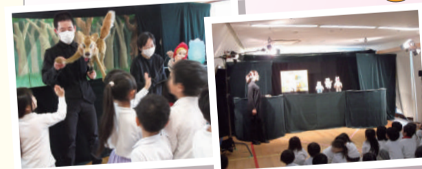
社会福祉法人こうほうえん キッズタウン東十条保育園 北区東十条3-18-40 産休明け(生後58日)から就学までのお子さまをお預かりしている私立の認可保育園です。通常の保育に加え、一時保育、病後児保育、子育て支援などの事業も行っていきます。

お話が大好きで日頃から絵本やパネルシアターを喜んで見ている子どもたちに、人形劇をみせたいと考え申請させていただきました。最近では家庭でのTVやスマホなどを使用した子守りの影響による子どもたちのコミュニケーション力の低下が問題視されています。生のお芝居に触れる機会をつくり、子どもたちにお話の世界をより一層楽しんでもらいたいと考えました。人形劇をみながら友達と一緒に笑ったり、ドキドキわくわくしたり、ハラハラしたりさまざまな感情を味わうことができました。こういう経験が子どもたちの豊かな感性を育むことにつながっていくと思われます。楽しい時間を過ごすことができました。ありがとうございました。