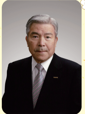
北区社会福祉協議会会長

本年も、感染防止対策を講じつつ、更なる事業の充実と活動の展開に取り組んでまいりますので、みなさまからの一層のご支援とご協力をお願いいたしまして、年頭の挨拶とさせていただきます。