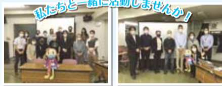
ボランティアスタッフのみなさん