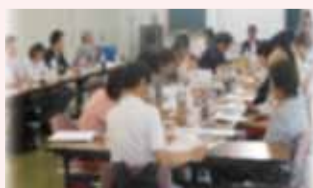
情報交換会では活発な意見交換がなされました。

関係機関、町会・自治会、民生委員・児童委員の方々に向けた、団体や活動の周知活動を行います。