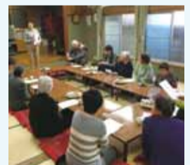
高齢者向けカフェの様子