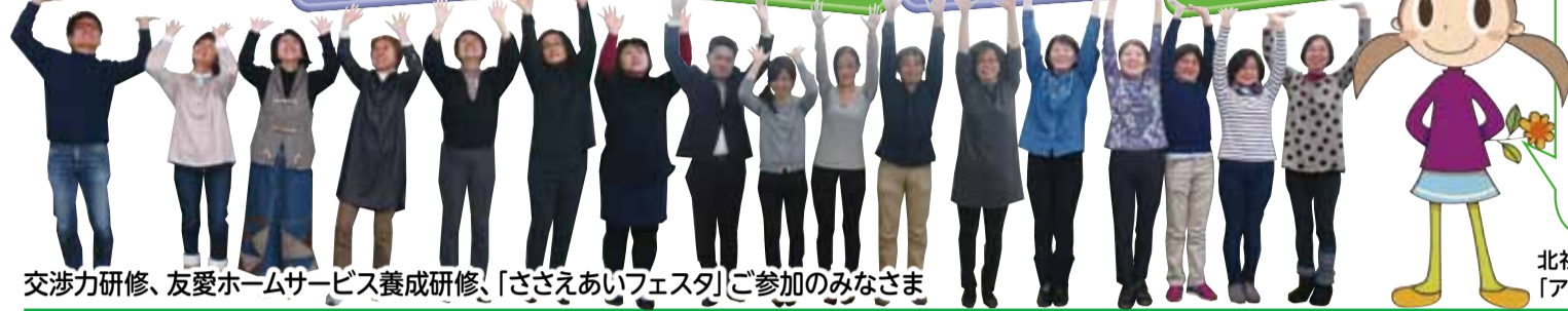
交渉力研修、友愛ホームサービス養成研修、「ささえあいフェスタ」ご参加のみなさま