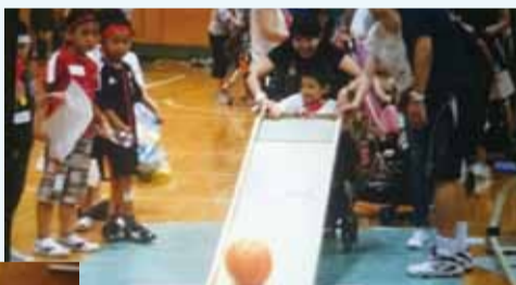
「しっかり狙って」大人も子どももボレーゲームで楽しみました。

28年度は助成をうけ、初めての大運動会を実施、体操の先生やボランティアの方々を含め100名を超える参加者で、とても充実した一日を過ごすことができました。ありがとうございました。