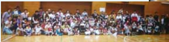
みんな一緒に記念撮影