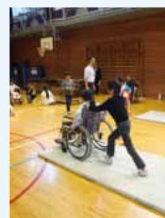
車イスを使った体験学習