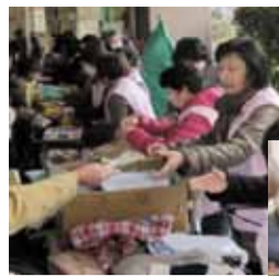
バザーの様子 地域の民生委員・児童委員のみならずさまにご協力いただいております。

【内容】 ●バザー ●模擬店 ●ご利用者の作品販売 ●福祉施設・団体による販売 ●体験コーナー(介護予防体操など) ●ミニコンサート