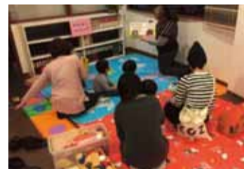
ボランティアによる絵本の読み聞かせ

「実際に支援を必要としている子どもがみなさんの身近な所にいます。地域の子どもたちを共に支えていきましょう!」「地域のだれでも参加できます。」