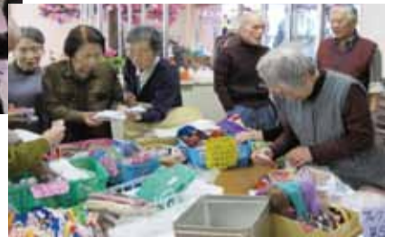
デイホーム利用者がまごころ込めて作った作品を販売しています。