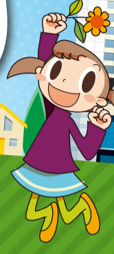
北社協キャラクター「アイちゃん」