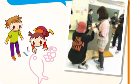
職業体験(左官職人体験)の様子

小中学生の将来に対する夢の実現に向けた体験の場の一つとして、「小中学生対象の職業体験イベント」を実施しました。