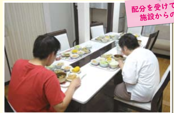
配分を受けている 施設からの声

以前は限られたスペースのなか交代で食事をしていましたが、おかげさまで全員そろって食事ができる環境となりました。コロナ禍中のため、集まることに制約はありますが、ご協力いただいたみなさまには大変感謝しております。