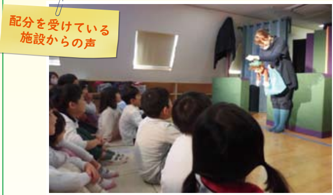
配分を受けている 施設からの声