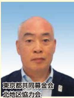
東京都共同募金会 北地区協力会

今年度におきましても北区の福祉が更に充実することを願って、みなさまにはぜひご協力をお願いいたします。