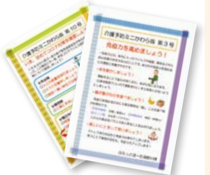
介護予防ミニかわら版