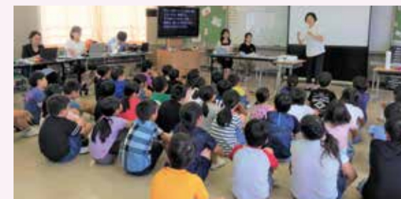
福祉学習プログラムの様子