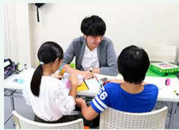
大学生ボランティアによる学習支援教室の様子。大学生のお兄さんに勉強を見守ってもらい、子ども達の勉強意欲も高まっています。

地域の大人や学生と関わる機会は、子どもが新しいことに興味を持ち、困難に出会った際にそれを乗り越える力となります！