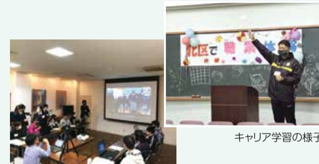
オンライン学習の様子

北区を中心に活動する(一社)SHOINと(公社)東京青年会議所北区委員会、北社協が連携して、子どもの興味、関心を高め、将来の夢や目標につながる職業体験イベントを実施しています。