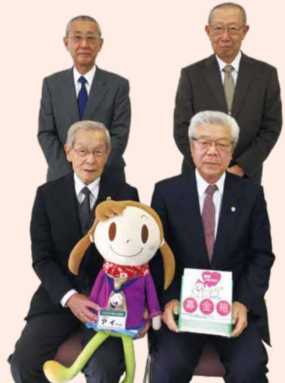
北区民生委員・児童委員協議会会長、北区社会福祉協議会会長 北区町会自治会連合会会長、北区日本赤十字奉仕団副委員長

Facebookやっています！ 北社協の最新情報やお知らせを随時掲載しています。ぜひご覧になってみてください！