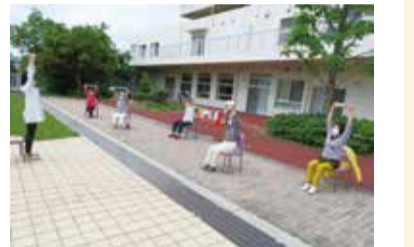
屋外での体操講座

さらに、町会・自治会や地域の高齢者あんしんセンターと連携しながら屋外での体操講座の開催など、その時の状況を踏まえて地域のみなさんが健康でいきいきと暮らせるようお手伝いをしています。