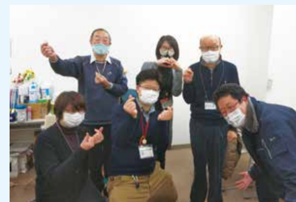
社会福祉法人光照園 豊島高齢者あんしんセンター職員とボランティアの皆さん